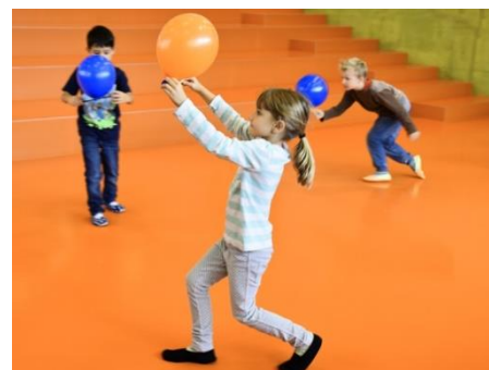
StartUp Musik & Bewegung