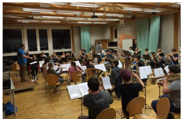
Probe Regionales Jugendblasorchester