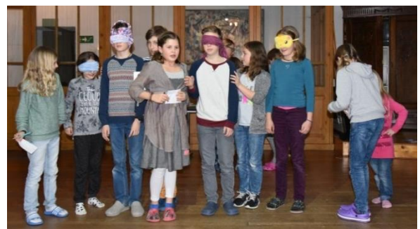
Bunter Abend im Musikschullager 2016 in Dangio/TI

Schülerbeurteilungen, Erscheinungsbild Musikschule, Kontaktpflege nach aussen, Eröffnungstag, Parcours, Zauberschloss, Musizierstunden u.v.m.